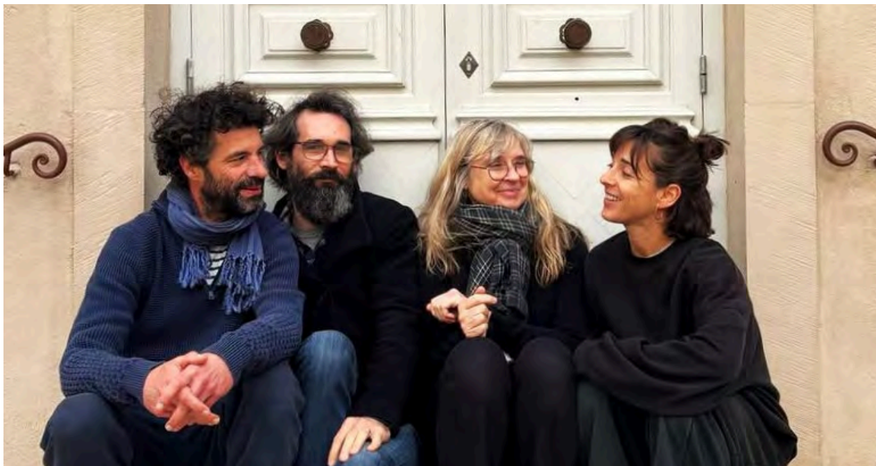
photos : résidences à St-Antoine l'Abbaye et Pézenas © KD Danse en couverture : DR